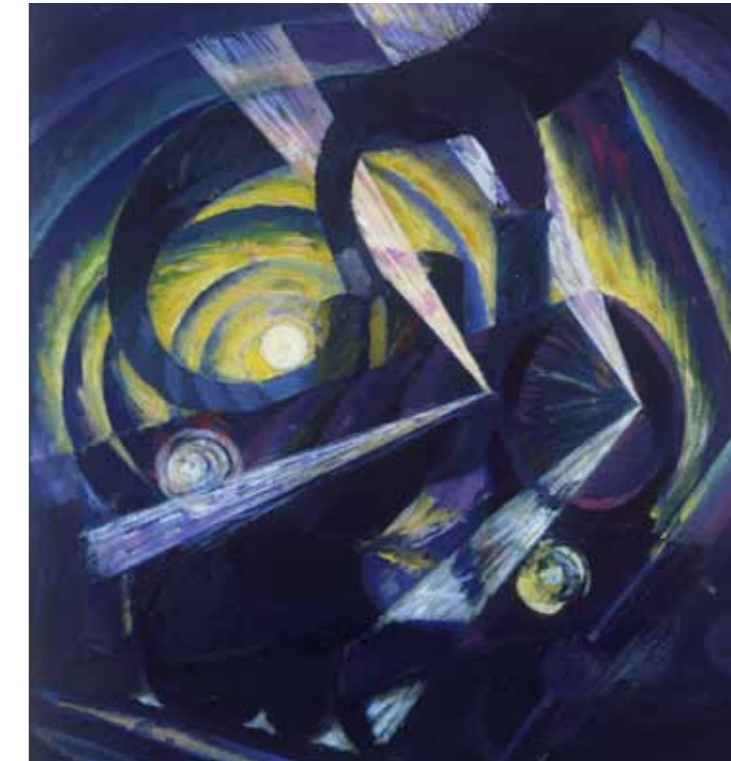
Luigi Russolo, 1409, Dinamismo di un treno in corsa nella notte (part.) , 1911 ca. Roma, Collezione M. Carpi

The works of Michetti, Signorini, Morbelli, Fattori and Boccioni will show the Bel Paese through images of its fascinating traditions and costumes. The lives of Italians in those days as portrayed by Lega, Cremona, De Nittis, Boldini and Pelizza da Volpedo will also be on display. A rich section is dedicated to photography, featuring some of its pioneers. The exhibition closes with the dawn of Futurism: Boccioni, Balla, Depero, Carrà and Russolo , determined to erase the last traces of the 1800s.