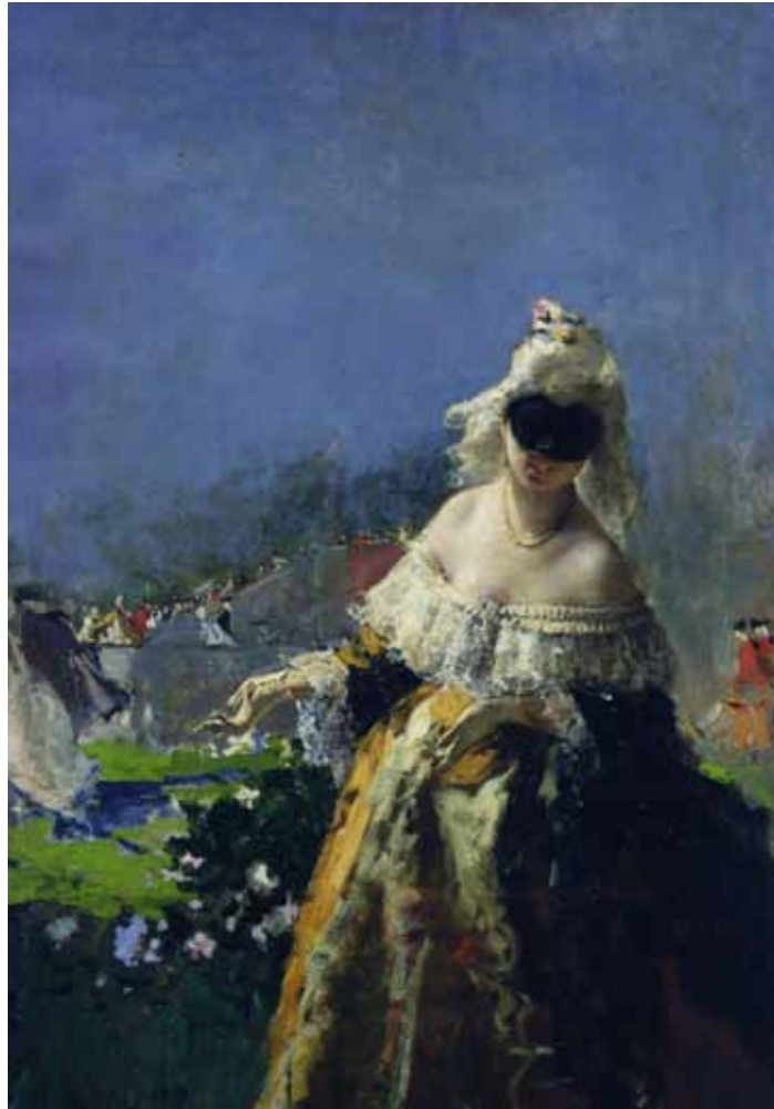
Mosè Bianchi, Invito alla danza (part.) , 1870 Milano, Museo Nazionale Scienza e Tecnologia Leonardo da Vinci

Il Bel Paese. L'Italia dal Risorgimento alla Grande Guerra, dai Macchiaioli ai Futuristi, realizzata grazie al prezioso sostegno della Fondazione Cassa di Risparmio di Ravenna, intende restituire la rappresentazione del paesaggio, della cultura e della società italiana dal Risorgimento al primo conflitto mondiale, di cui cade il centenario proprio nel 2015.