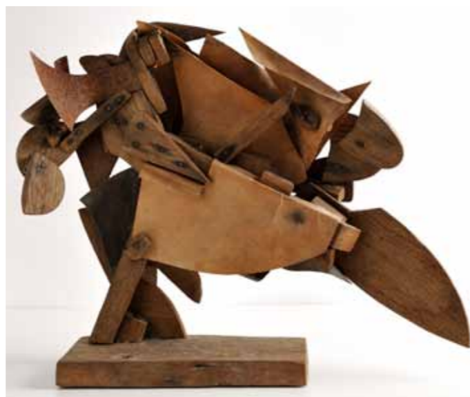
Umberto Boccioni, Costruzione dinamica di un galoppo , 1914 Collezione privata

Servizio a carattere sociale ed informativo di Seat Pagine Gialle. Costo da fisso €0,026 al secondo più €0,36 alla risposta (IVA incl.). Costo da mobile in funzione del gestore. Info e costi www.892424.it