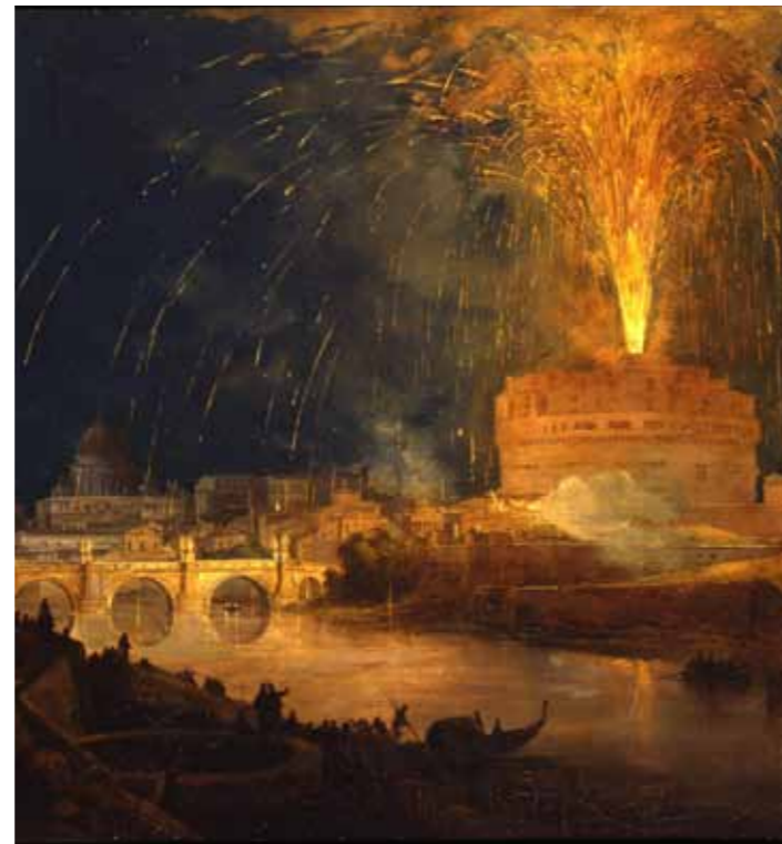
Ippolito Caffi, La girandola a Castel Sant'Angelo (part.) , s.d. Collezione privata

Il Bel Paese sarà poi raccontato anche attraverso immagini suggestive di tradizioni e costumi, grazie alle opere di Michetti, Signorini, Morbelli, Fattori, Boccioni , per citare solo alcuni nomi. Non mancherà lo sguardo sui momenti di vita degli italiani offerto, tra gli altri, da Lega, Cremona, De Nittis, Boldini, Pelizza da Volpedo completato dalla ricca sezione dedicata alla fotografia con alcuni dei suoi storici pionieri. Infine l'avvento del Futurismo , con artisti quali Boccioni, Balla, Depero, Carrà, Russolo , decisi a spazzare via ogni residuo della cultura e della sensibilità ottocentesche, prima della Grande Guerra, vero spartiacque tra i due secoli.