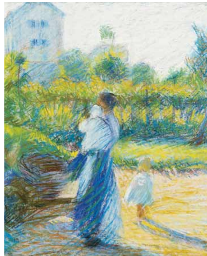
Umberto Boccioni, Donna in giardino (part.) , 1910 Collezione Intesa Sanpaolo - Gallerie d'Italia - Piazza Scala, Milano